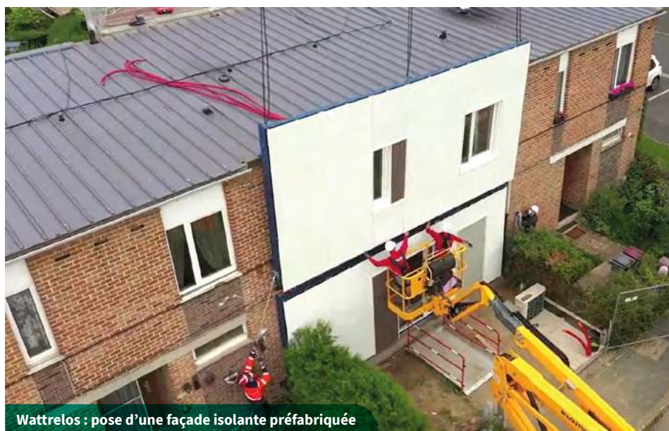
Wattrelos : pose d'une façade isolante préfabriquée dans le cadre de la réhabilitation EnergieSprong

En juin 2023, l'entreprise a lancé la réhabilitation selon cette méthode de 173 logements répartis entre les villes de Roubaix, Tourcoing et Bondues.