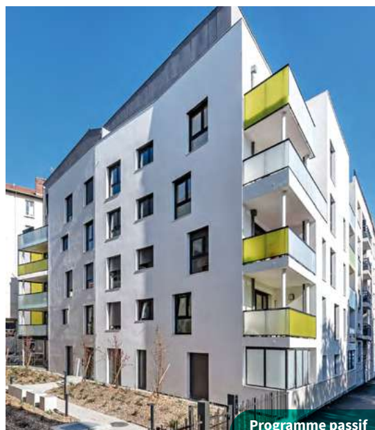
Programme passif Les Alizés à Lyon

Ces prouesses techniques ont des bénéfices considérables pour les locataires : meilleur confort acoustique, logement plus sain avec un air régulièrement renouvelé, meilleur confort thermique et meilleure maîtrise de la consommation énergétique. Il faut ainsi compter environ 15€ par mois pour combler les besoins énergétiques d'un T3 de 65 m 2 .