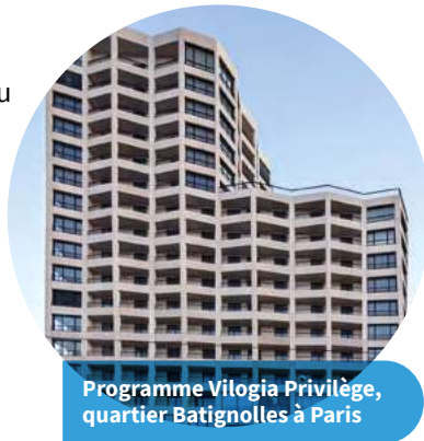
Programme Vilogia Privilège, quartier Batignolles à Paris

Il s'agit de logements situés au plus près des bassins d'emploi, dont les loyers sont inférieurs de 10 à 15% aux prix du marché. Ces logements restent soumis à des plafonds de ressources. Vilogia Privilège en gère plus de 1 900.