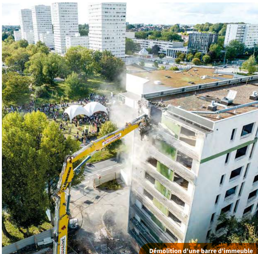
Démolition d'une barre d'immeuble à Mons-en-Baroeul

Le Groupe Vilogia s'est affirmé en tant qu'acteur du renouvellement urbain en participant à 17 grands projets de ce programme commencé en 2004. À travers d'importants travaux de démolition, de reconstruction et de réhabilitation, Vilogia a contribué à changer l'image de nombreuses villes comme ici à Mons-en-Baroeul où les vieux immeubles ont laissé place à des résidences à taille humaine, à l'architecture soignée et au confort thermique optimisé.