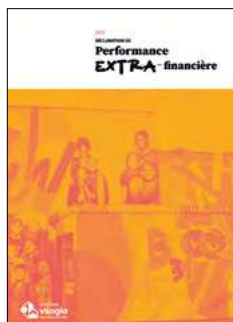
Déclaration de performance extra-financière 2023