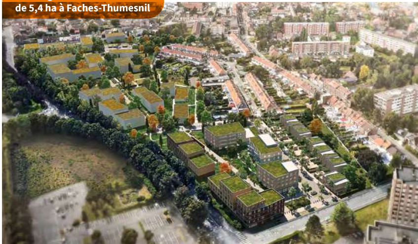
Aménagement d'une friche de 5,4 ha à Faches-Thumesnil

En 2023, le Groupe Vilogia a construit 2 643 logements, ce qui représente un investissement de 505 millions d'euros et fait de Vilogia l'un des bailleurs français les plus dynamiques. Dans le même temps, 1 813 logements ont été réhabilités. Partout, les projets de construction et de réhabilitation menés par Vilogia sont reconnus pour leur qualité et pour leur caractère innovant.