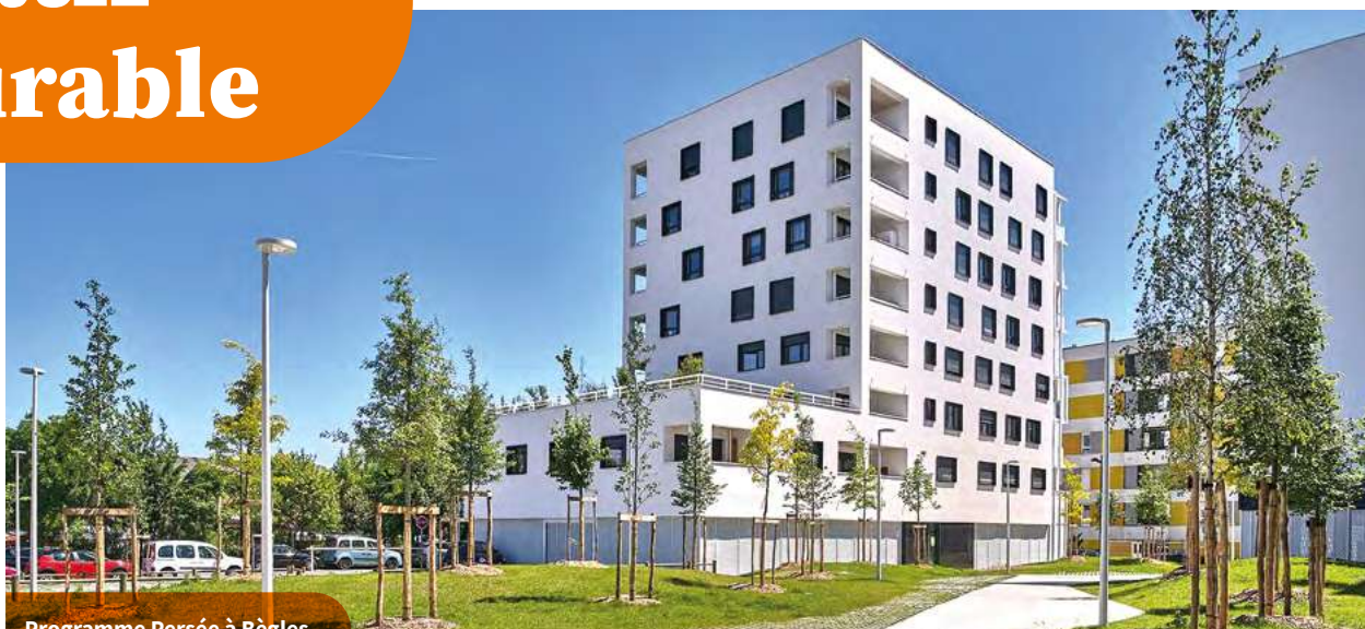
Programme Persée à Bègles