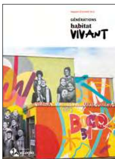
Rapport d'activité 2023