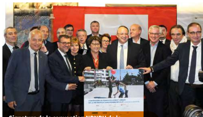
Signature de la convention NPNRU de la Métropole Européenne de Lille le 20 décembre 2019

Là encore, Vilogia a répondu présent et s'est engagé dans 21 projets répartis entre la Métropole Européenne de Lille, l'Île-de-France, la métropole nantaise et le Grand Sud. Dans les 10 prochaines années, pas moins de 2093 logements doivent être déconstruits et reconstruits tandis que 2 927 autres seront réhabilités pour un budget total de 640 millions d'euros.