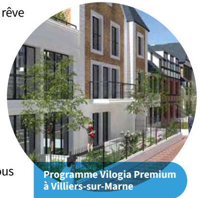
Programme Vilogia Premium à Villiers-sur-Marne

Les acquéreurs doivent respecter des conditions de ressources et peuvent bénéficier d'aides de l'État.