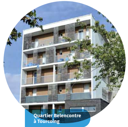
Quartier Belencontre à Tourcoing

* Plafonds de ressources hors Île-de-France