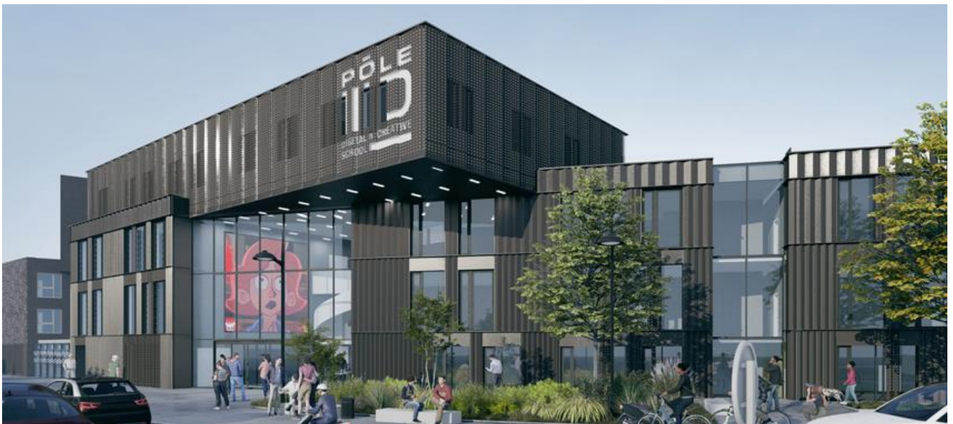
Perspective de la partie école - © De Alzua + et Archiae

D'une surface de 5000 m 2 , le bâtiment accueillera à horizon 2025 près de 650 étudiants contre 400 actuellement et logera une centaine d'entre eux. Labelisés « Energie Positive et Réduction de Carbone » ou « E+C- » de niveau 2, les logements seront à la pointe de la performance environnementale et offriront des conditions de confort optimales aux étudiants. Ce projet novateur a la particularité de proposer un concept d'école-résidence qui invitera la ville en son sein, via sa place Agora (ouverte à tous les publics) et les différents services (restauration, co-working, média-ludothèque, amphi / cinéclub...). Les espaces pédagogiques et de travail seront ouverts 24h/24h aux étudiants. Le programme comporte des surfaces à usage pédagogique (2 800 m 2 avec ateliers et factories) et d'autres dédiées au logement des étudiants (3 000 m 2 ).