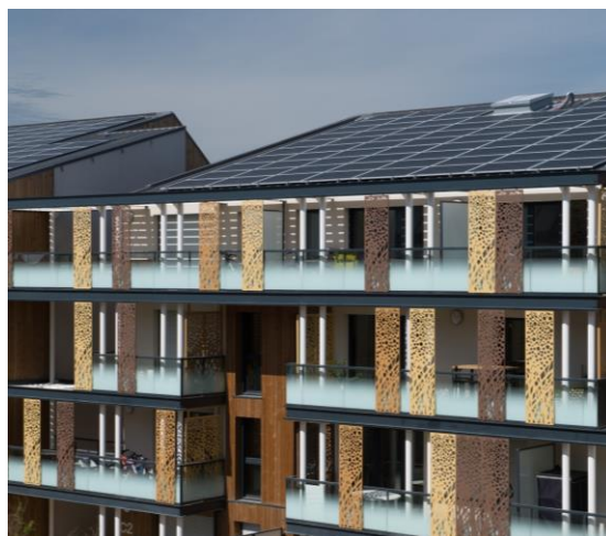
Soléo, 110 logements passifs livrés à Carquefou, près de Nantes (44)