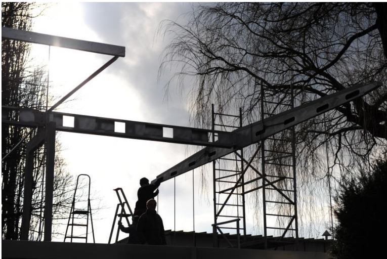
Remontage de la structure du Pavillon lors de sa réhabilitation en 2013

Avec son système constructif du type « Métropole » composé de deux portiques métalliques centraux et d'une poutre faîtière sur laquelle s'emboîte la toiture, constituée de bacs en aluminium, ces Pavillons étaient rapides à monter, spacieux et modulables. Faute de commandes suffisantes, ils ne réussirent pourtant pas à s'imposer à l'époque.