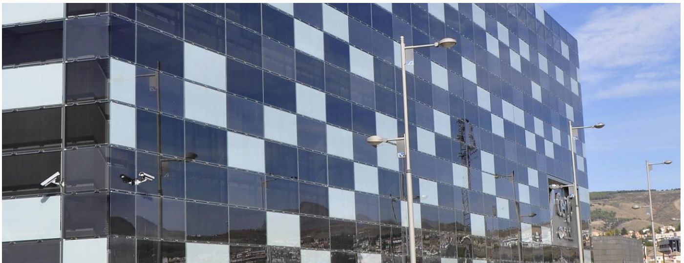
Un exemple d'application de panneaux photovoltaïques en façade