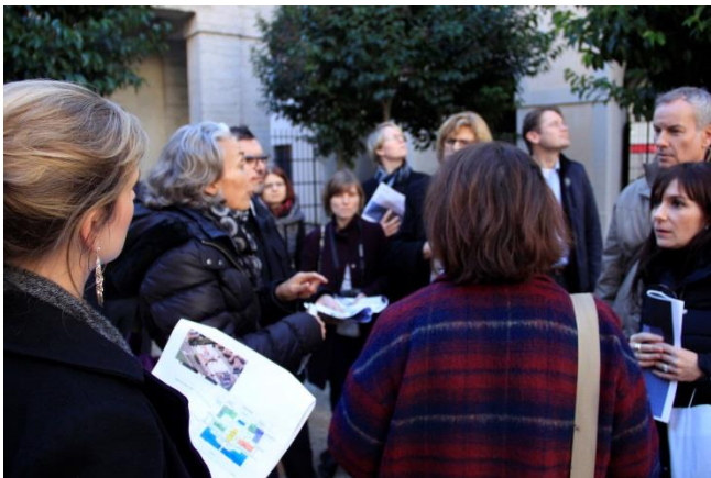
Visite de membres d'EFL à Lyon chez Vilogia. 11/2016

EFL, European Federation for Living (Fédération Européenne pour l'Habitat), regroupe près de 50 membres parmi lesquels des bailleurs issus de 9 pays européens. Ils représentent un patrimoine de plus de 650 000 logements. Vilogia, membre actif de cette fédération, accueille son assemblée générale les 10 et 11 mai au siège de l'entreprise à Villeneuve d'Ascq.