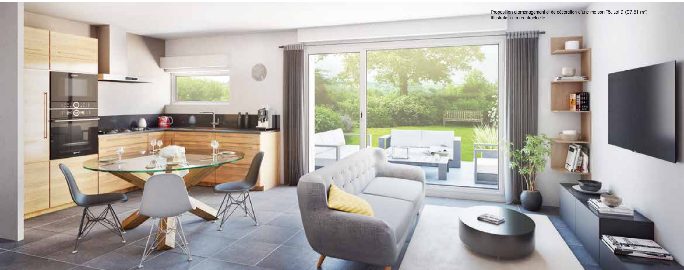
Proposition d'aménagement et de décoration d'une maison T5. Lot D (97,51 m 2 ) Illustration non contractuelle