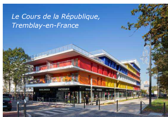
Le Cours de la République, Tremblay-en-France

Son objectif : loger en priorité les salariés aux revenus modestes et accompagner le développement économique des territoires.