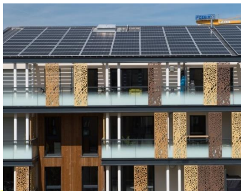
Soléo, Carquefou (44)