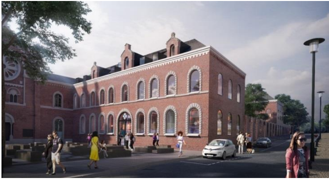
Vue du boulevard de Strasbourg

Sur un site d'exception, l'écriture architecturale choisie s'avère sobre et respectueuse des lieux en proposant de révéler et d'amplifier les qualités préexistantes du bâtiment.