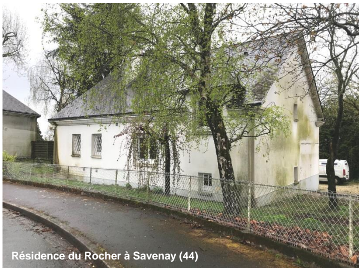
Résidence du Rocher à Savenay (44)

Les 233 logements acquis auprès d'ICF Habitat en Loire-Atlantique, sur les communes de Cordemais, Malville, Savenay et Saint-Etienne-de-Montluc, s'inscrivent dans la stratégie locale de renforcement d'une offre résidentielle à taille humaine.