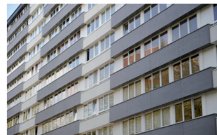
Réhabilitation de 66 appartements Le Centaure - Roubaix