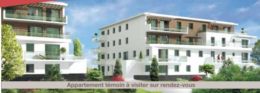
Appartement témoin à visiter sur rendez-vous

Appartements de 66 à 113 m 2 , répartis en deux petits immeubles, 2 et 3 chambres.